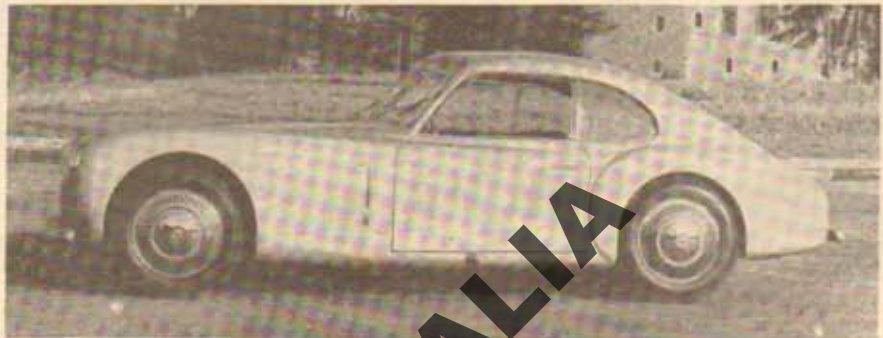
La conduite intérieure Grand Sport Cisitalia.

Ce dernier point si important aux yeux de l'usager, en ce qui concerne la conduite, et si essentiel quant à l'économie de consommation, fera l'objet d'études prochaines dans la Revue.