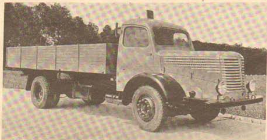
Le camion 7 tonnes Unio, type Z.U. 70.

goire, par exemple, ainsi que les travaux de Julien, Bernardet, Dolo, de Rovin, Boitel, Claveau, Aérocarène, Dechaux, etc).