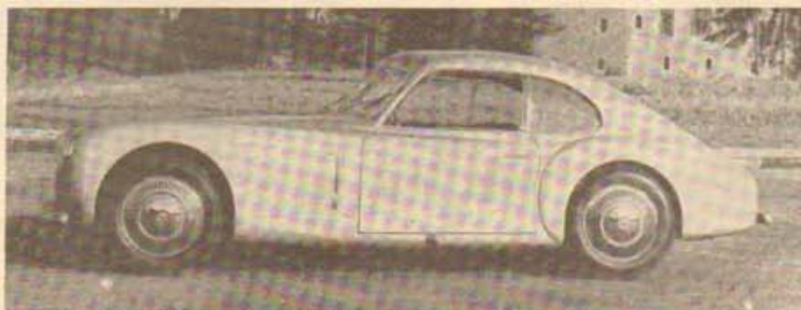
La conduite intérieure Grand Sport Cistalia.

Ce dernier point si important aux yeux de l'usager, en ce qui concerne la conduite, et si essentiel quant à l'économie de consommation, fera l'objet d'études prochaines dans la Revue.