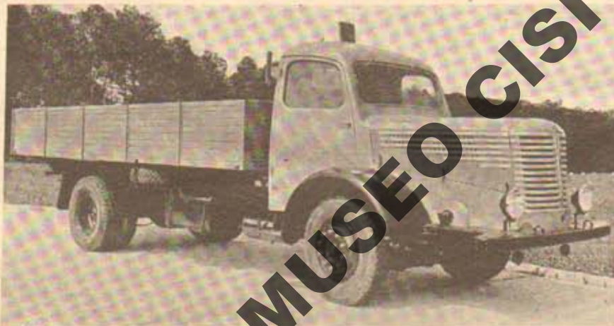
Le camion 7 tonnes Unic, type Z.U. 70.

goire, par exemple, ainsi que les travaux de Julien, Bernardet, Dolo, de Rovin, Boitel, Claveau, Aérocarène, Dechaux, etc).