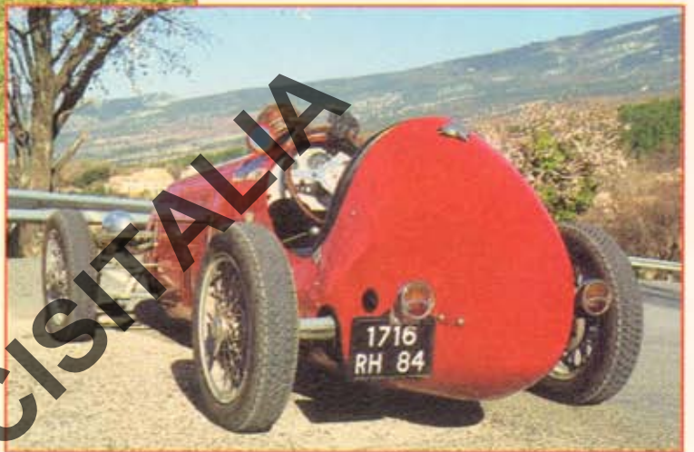
Les accessoires d'éclairage et la plaque d'immatriculation à l'esthétique discutable permettent néanmoins de circuler sans contrainte sur les magnifiques petites routes du pays provençal.

Avec cette monoplace, il reste le moteur et la boîte présélective d'origine en réserve alors que cela aurait dû servir au montage. On tire les éléments mécaniques de Fiat, le cousinage avec Simca s'avère évident et l'erreur peu visible. Et puis elle offre un avantage considérable... la tranquillité d'esprit. Sachant que si le moteur explose, ce n'est pas aussi grave que si l'on